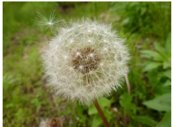
セイヨウタンポポ