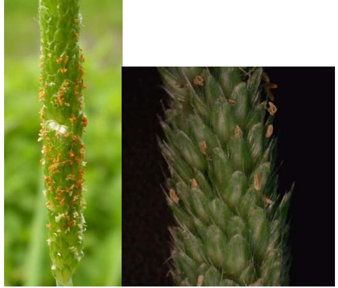
スズメノテッポウ