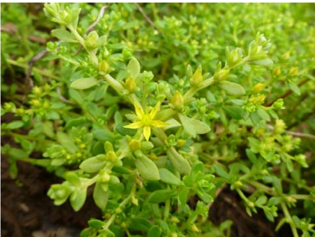
コモチマンネングサ