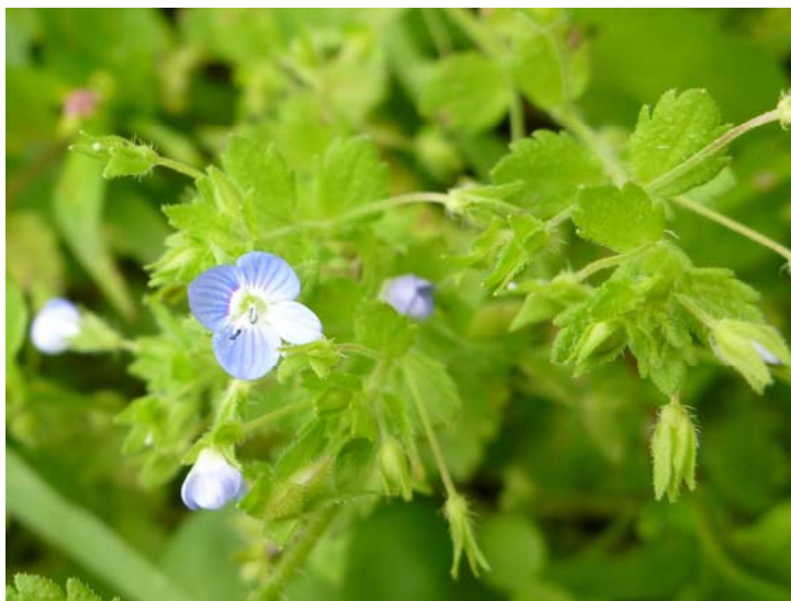
オオイヌノフグリ